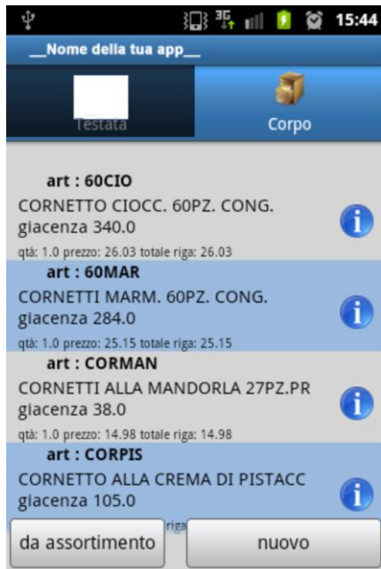
Figura 2 - Gestione assortimento