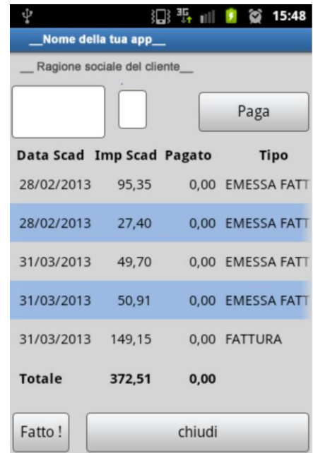
Figura 3 - Gestione partite aperte