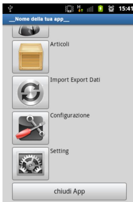
Figura 1 - Pagina iniziale

Il sistema è costituito anche da un software, da installare su un server, detto concentratore e collegabile ad altro gestionale aziendale mediante sistemi di sincronizzazione dati.