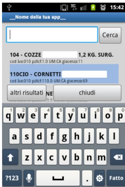
Figura 4 - Ricerca di magazzino